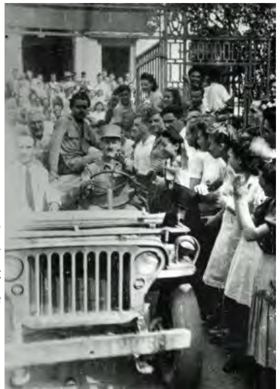
Le Général LECLERC au volant de sa jeep dans Hanoï (18 mars 1946)

Persévérance, pour atteindre tout objectif voulu avec détermination. Excellence, par toute stratégie utile et efficace. L'esprit LECLERC, laissé en héritage par notre grand Héros national, opère, nous encourage à nous construire pour regagner la confiance en notre personne de « roseau pensant », à nous épanouir intelligemment tout au long du chemin de vie des terriens que nous sommes.