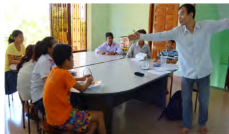
Apprentissage de l'anglais