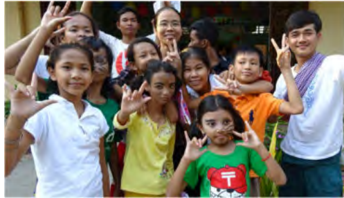
Langage des signes