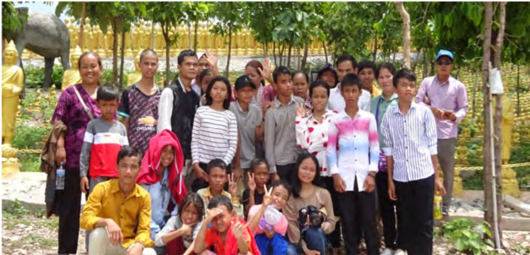
Le foyer Light of Mercy en groupe