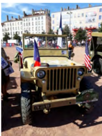
Exposition de véhicules militaires Place Bellecour à Lyon -