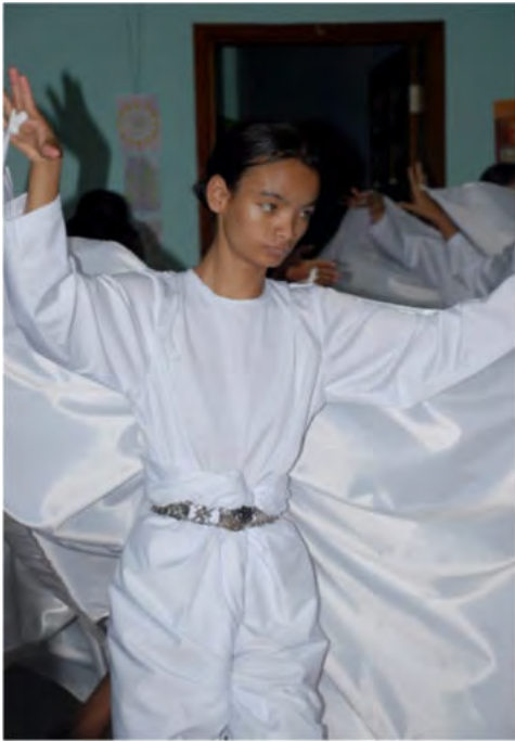
Danse et musique par les enfants aveugles