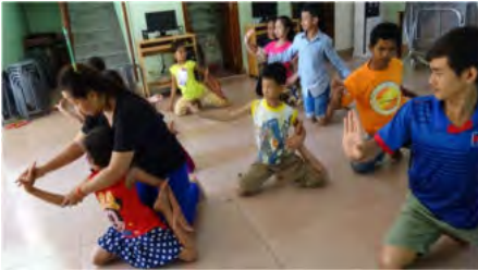
Danse traditionnelle khmère

Le foyer Light of Mercy, « Lumière de Pitié », est une institution cambodgienne soutenue par l'ANAI depuis de nombreuses années. Ce foyer a été créé en 1997 afin de donner une chance aux aveugles, sourds et muets et aux enfants handicapés, tous issus de familles pauvres et plus ou moins abandonnés. Une trentaine d'enfants sont actuellement scolarisés ont un suivi médical et sont inscrits à des activités extra-scolaires leur permettant de développer leurs capacités.