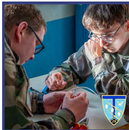
UNITÉ 28 e régiment de transmissions