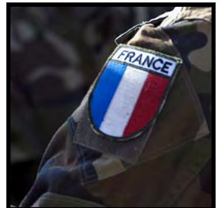
DOSSIER Stage sur l'influence militaire au CIAE