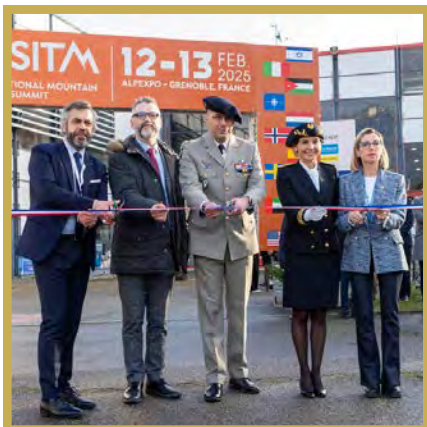
ACTUS Première édition du Sommet International des Troupes de Montagne