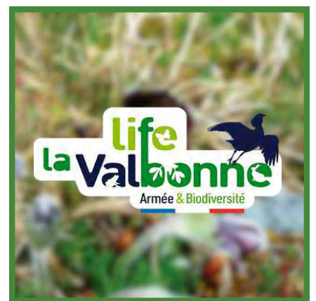
DOSSIER Le projet LIFE La Valbonne