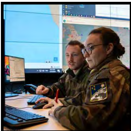
ACTUS Exercice AIREX au CDAOA