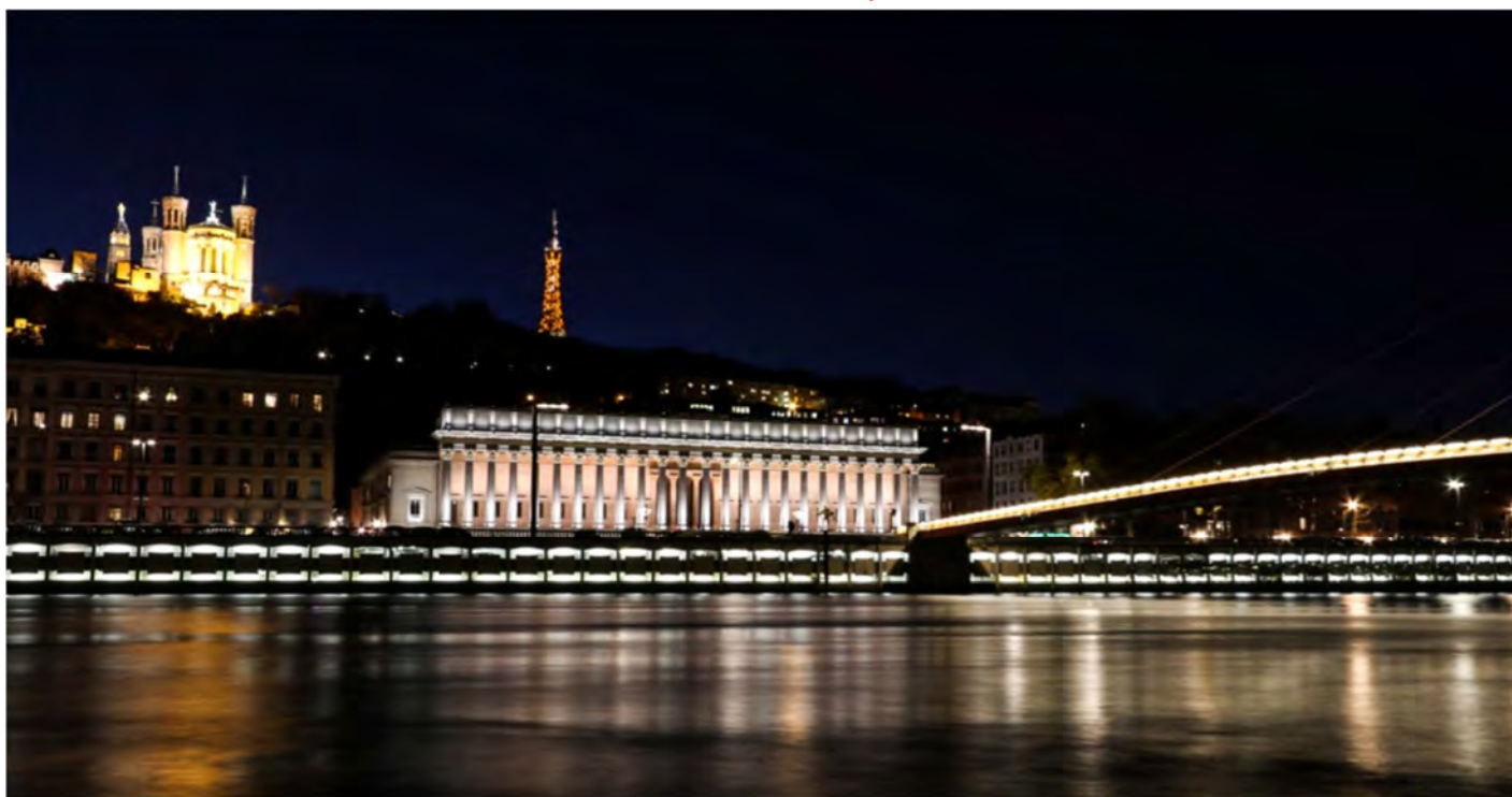
LYON, basilique de Fourvière et l'ancien palais de justice (appelé les 24 colonnes par les lyonnais)