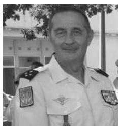
Le général Guionie