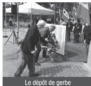
Le dépôt de gerbe