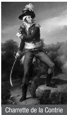
Charrette de la Contrie