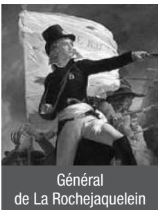
Général de La Rochejaquelein

A l'issue des discussions entre généraux, et après que le prince de Talmont a déclaré qu'un messenger habilité (le chevalier de Tinténiac) lui avait affirmé que les Anglais étaient disposés à apporter leur concours à la cause, sous réserve de pouvoir bénéficier de la liberté d'un port sur les côtes françaises, il est décidé de rejoindre les côtes de la Manche pour faire le nécessaire.