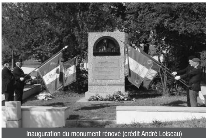
Inauguration du monument rénové

Cérémonie organisée par la ville de Sathonay-Camp, avec la participation du maire, du député de la circonscription, du général de corps d'armée commandant la gendarmerie d'Auvergne Rhône-Alpes, du délégué militaire départemental adjoint représentant le gouverneur militaire de Lyon, du colonel commandant la base de défense de Lyon, et de l'orchestre d'harmonie des anciens et amis de la musique du 99° RIA.