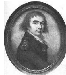
Comte Joseph de Puisaye