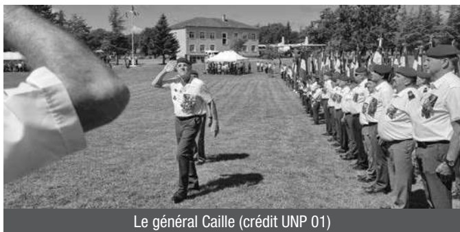
Le général Caille

Le congrès annuel de l'Union nationale des parachutistes s'est déroulé cette année au camp de Caylus (Tarn-et-Garonne), les 9 et 10 juin. Emprise militaire de 5500 hectares de bois et de prairies, le camp héberge le centre de formation initiale des militaires du rang (CFIM) – 6 e régiment de parachutistes d'infanterie de marine (6 e RPIMa) de la 11 e brigade parachutiste.