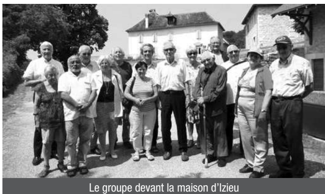
Le groupe devant la maison d'Izieu

Dans le cadre du devoir de Mémoire, l'association des Anciens Combattants de l'Équipement du Département du Rhône renforcée par quelques