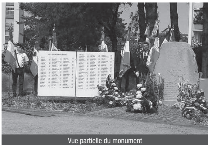
Vue partielle du monument