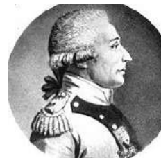
Comte Charles d'Hervilly

Le 16 juin 1795, le commodore Sir John Warren appareille de Portsmouth avec une flotte puissante pour convoyer vers la presqu'île de Quiberon, qui a été préférée à la baie de Saint-Brieuc, 4 000 émigrés distingués, formés, équipés, armés à l'anglaise, placés sous les ordres du comte de Puisaye, et volontaires pour mettre à exécution le plan séduisant de reconquête. Puisaye, conscient de son inexpérience militaire de terrain, s'est adjoint un officier de carrière qui s'était brillamment illustré lors de la guerre d'indépendance américaine, le comte Charles d'Hervilly. Or, celui-ci est approché, puis manipulé par l'abbé André-Charles Brottier, directeur de « l'Agence royaliste de Paris » qui lui assure que le but véritable de Puisaye est de remplacer la branche aînée des Bourbons par la cadette des Orléans. Profondément légitimiste, d'Hervilly n'aura de cesse désormais qu'à torpiller l'expédition.