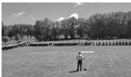
Vue d'ensemble du dispositif