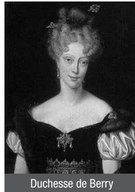
Duchesse de Berry

Vendée contre l'Orléanais, le roi Louis-Philippe.