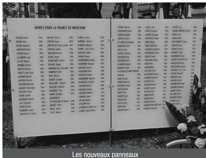
Les nouveaux panneaux

Madame l'adjointe, comme nous l'avons tous constaté, les plaques du monument ont été changées. Elles sont plus lisibles, certainement plus résistantes aux dégradations. Au nom du comité d'entente Indochine, je tiens donc à remercier la ville de Lyon pour avoir respecté son engagement pris l'année dernière. Reste le fleurissement. Nous sommes loin de la jungle tonkinoise, celle qui enserrait la cuvette de Dien Bien Phu. Patience donc, laissons le temps au temps, mais j'ai bien noté la volonté de la ville d'apporter des mesures correctrices à la végétalisation de l'espace mémoriel. Merci.