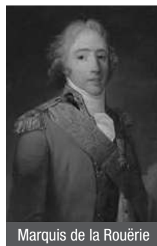
Marquis de La Rouërie

Le marquis de La Rouërie est un aristocrate qui s'est retiré, après s'être illustré lors de la guerre d'Indépendance américaine, en son château aux confins de la Bretagne et de la Normandie, en la vallée du Couesnon. Idéaliste, il croit au retour rapide de la monarchie et à la renaissance de la grande « Nation bretonne ».