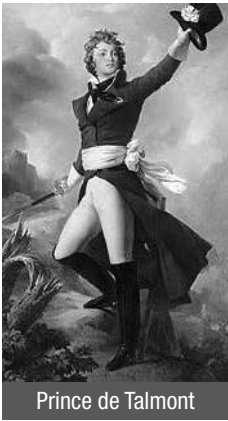
Prince de Talmont

mort de La Rouërie, il relève le gant de poursuivre son entreprise pour la cause. Il sait pouvoir compter sur Jean Cottereau, son vassal, qu'il a sauvé autrefois de la potence, et avec qui, malgré l'écart de statut, il a partagé quelques dévergondages. Et, derrière Jean, toutes les coteries chouannes adhèrent. De suite, le prince de Talmont perçoit que pour avoir l'assurance de